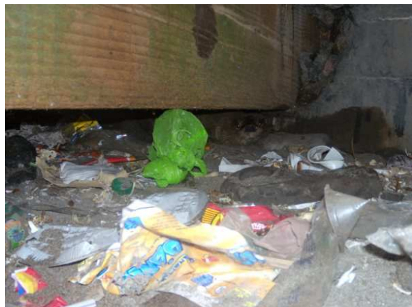
Figura 3. L. felina descansando bajo el muelle de Huanchaco, entre la basura.

competencia con su pesca. Es sabido que otra especie de mamífero marino, el lobo marino Otaria flavescens (Shaw, 1800), es visto como enemigo y fuerte competencia por los pescadores (Arias-Schreiber, 1993). Por otro lado, solo dos de los seis entrevistados sabían que la especie está protegida legalmente.