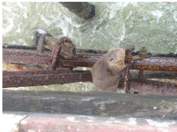
Figura 2. L. felina usando las estructuras del muelle artesanal de Huanchaco.

Durante las observaciones realizadas por los autores entre el 4 y el 6 de diciembre de 2009 se observó un (01) individuo moviéndose cerca del muelle artesanal (Figura 2). Durante los tres días de observación la nutria marina se refugió repetidamente debajo de la estructura del muelle, la cual presentaba restos de basura y desperdicios (Figura 3). En las entrevistas, cinco de los seis pescadores respondieron que han observado nutrias en Huanchaco alguna vez. Los mismos declararon haber visto solo un individuo sin que su presencia sea permanente a lo largo del año. Dos de aquellos pescadores detallaron que sus apariciones se limitan al verano. Cuatro de los seis pescadores entrevistados manifestaron su simpatía hacia las nutrias marinas, declarándolo un animal "bonito" al que no consideran un agente de