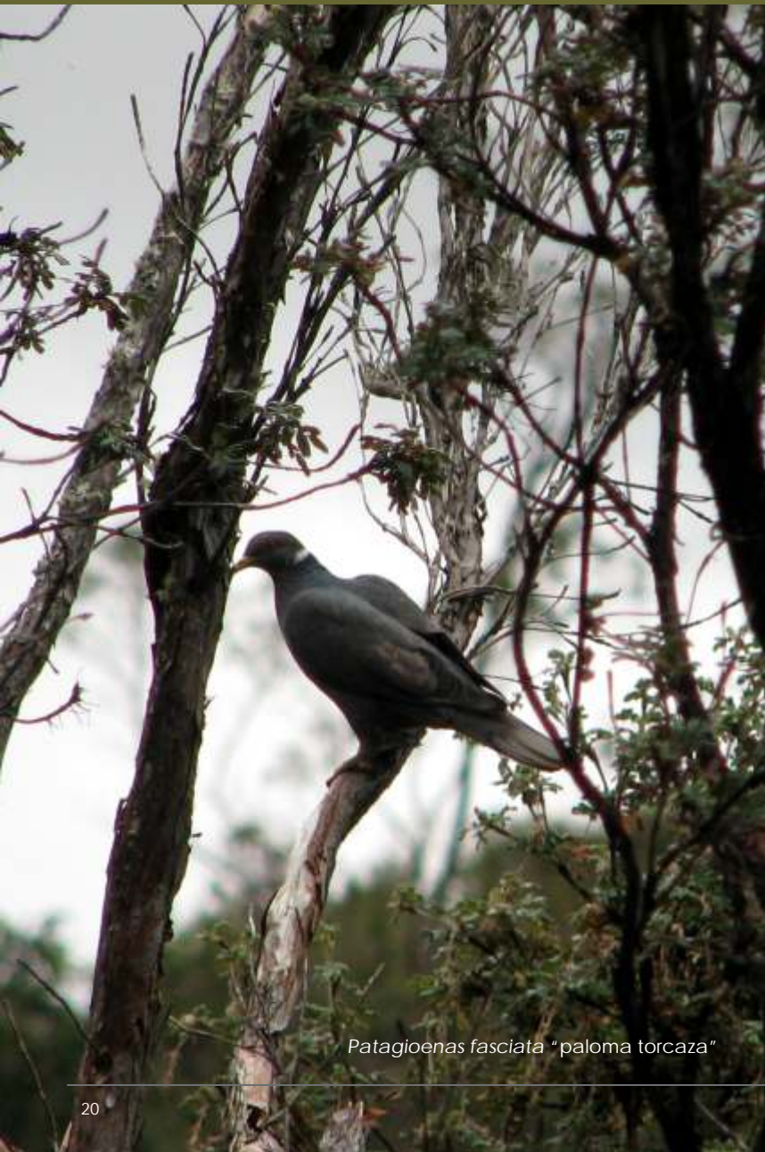
Patagioenas fasciata "paloma torcaza"