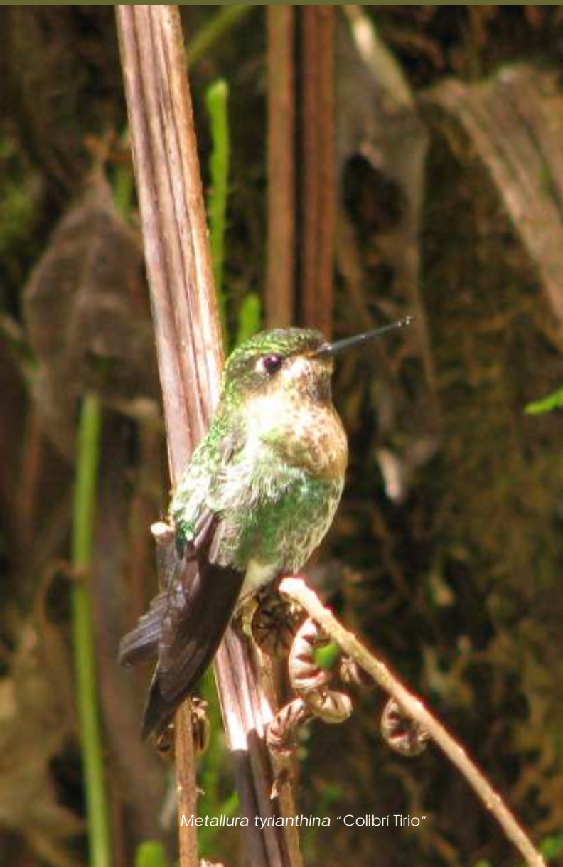
Metallura tyrianthina "Colibrí Tirio"