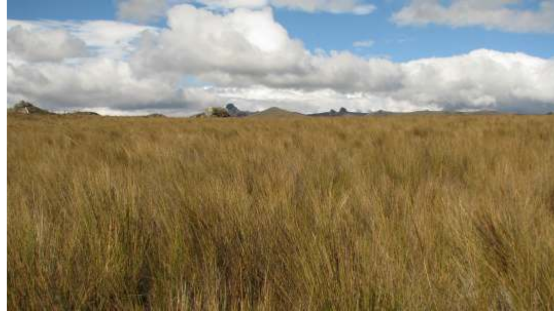
Mesetas y pajonales - El Porvenir

b) La parte media, está caracterizada por mesetas, penillanuras, lagunas y humedales. Esta área está cubierta por extensos pajonales, principalmente de "Ichu" Calamagrostis intermedia y Neurolepis asimetricea . En las quebradas y hondonadas se observan bosques relictos de "alisos" Alnus acuminata , "quinawiros" Polylepis reticulata , "Punzaros" Weinmannia ayabacensis , "Chachacomos" Escallonia myrtilloides y arbustos como "Zarzamoras" Rubus robustus "Chinchaguales" Hypericum laricifolium y especies herbáceas más pequeñas.