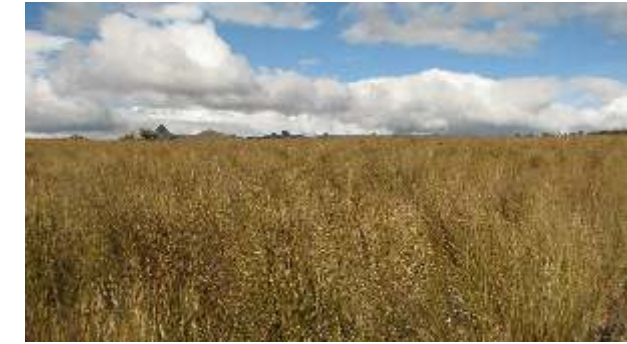
Pajonales del Páramo, El Porvenir- Huancabamba.