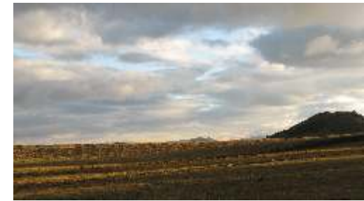
Penillanuras de la parte media - Huancacarpa alto.

b) La parte media, está caracterizada por mesetas, penillanuras, lagunas y humedales. Esta área está cubierta por extensos pajonales, principalmente de "Ichu" Calamagrostis intermedia y Neurolepis asimetricea . En las quebradas y hondonadas se observan bosques relictos de "alisos" Alnus acuminata , "quinawiros" Polylepis reticulata , "Punzaros" Weinmannia ayabacensis , "Chachacomos" Escallonia myrtilloides y arbustos como "Zarzamoras" Rubus robustus "Chinchaguales" Hypericum laricifolium y especies herbáceas más pequeñas.