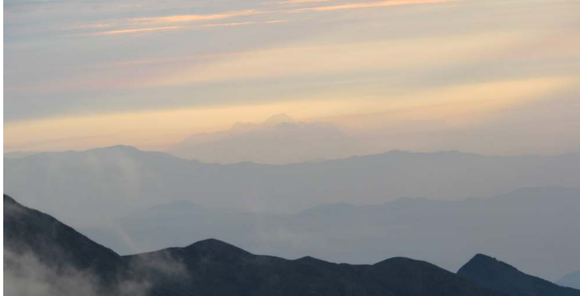
Cadenas montañosas de la ecorregión de los Andes del Norte

En estos ecosistemas alto andinos, la gran heterogeneidad de las condiciones ambientales y el medio físico, (pendiente, humedad, tipo de suelo, temperatura, vientos, etc) han generado una gran complejidad en la estructura de las comunidades bióticas.