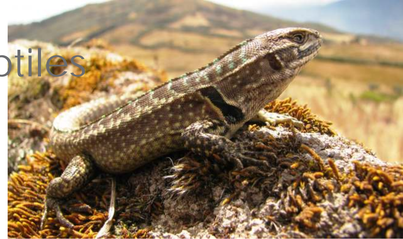
Stenocercus nubicola "lagartija"