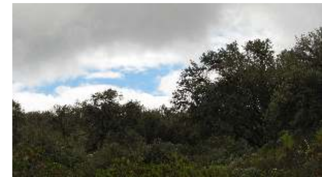
Bosques de Polylepis "quinawiros", Paríamarca Alto - Huancabamba.

Lamentablemente, los esfuerzos dirigidos hacia el estudio de la diversidad biológica de estas zonas han sido escasos, por lo que es necesario realizar más investigación científica para conocer su verdadera importancia ecológica y mantener el equilibrio natural en estos ecosistemas. En este sentido, hay que tener en cuenta que estos ambientes son las principales fuentes de recursos naturales del sureste de la Región Piura, que a su vez están expuestos a la colonización por especies exóticas, a las quemadas y la deforestación, a la minería informal, a la agricultura expansiva, la cacería, entre otras actividades productivas, que crecen diariamente en mayor proporción a las acciones de conservación y aprovechamiento sostenible.