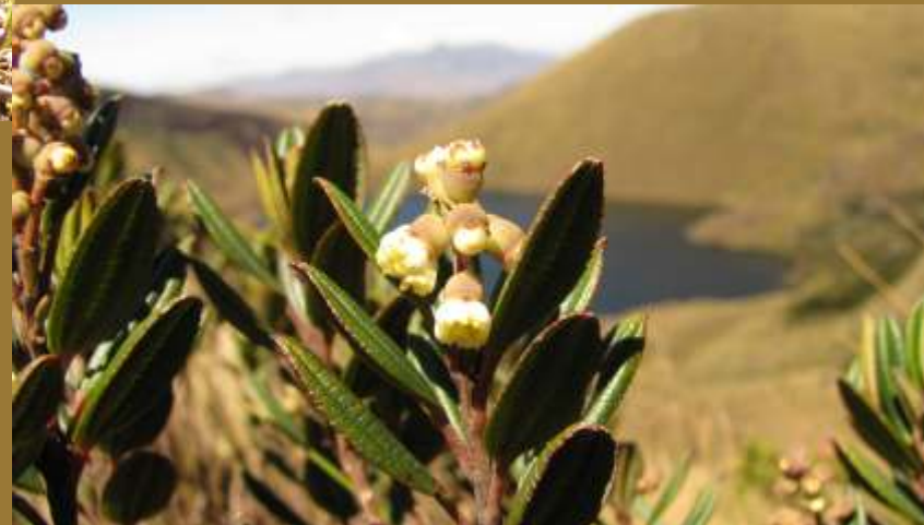
Miconia sp. “Miconia”

A estas especies de plantas se les atribuye las verdaderas funciones ecológicas de este ecosistema como “productor de agua”, pues en sus hojas se condensan las pequeñas gotas de agua que transporta la neblina, discurriéndola hacia el suelo, donde es retenida por sus raíces para luego ser liberadas lentamente en lagunas y pequeños quebradas que posteriormente forman los ríos.