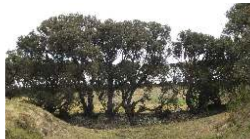
Cercos vivos de Polylepis reticulata "quinawiros" en la parte baja.