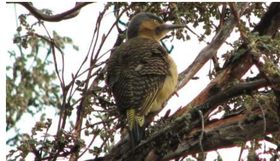
Colaptes rupicola "cangana"