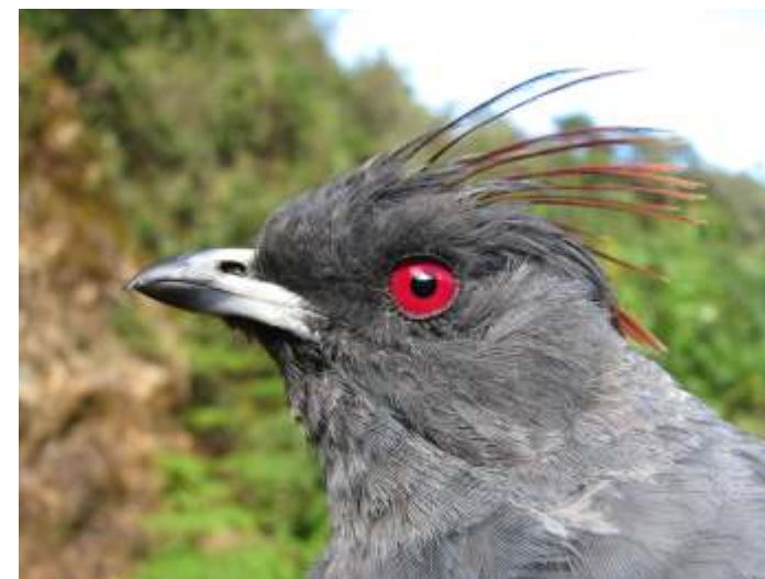
Ampelion rubrocristatus "Cotinga de Cresta Roja"