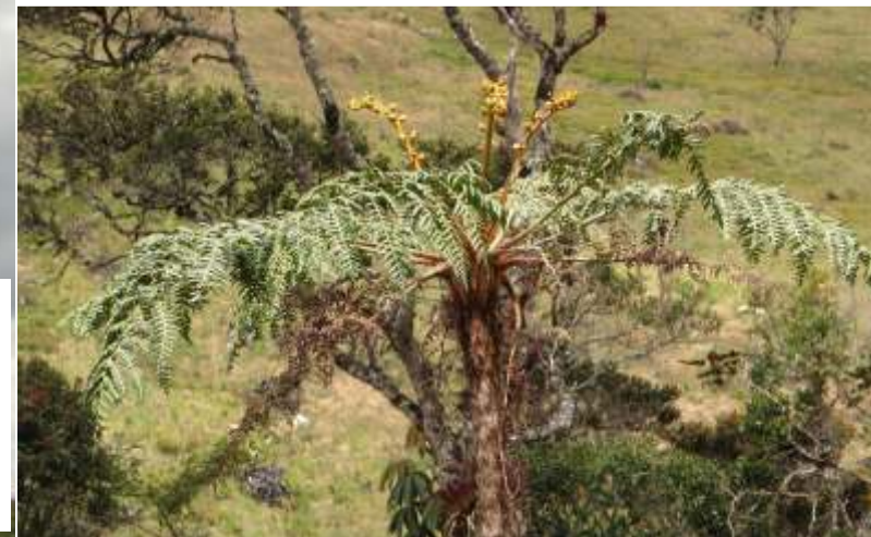
Dicksonia sp “ helecho arbóreo”

Especies de flora y fauna que habitan en los bosque húmedo de montaña