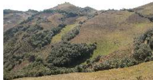
Fragmentos de bosque de Polylepis reticulata de la parte baja.

En la actualidad, la vegetación nativa de la parte baja casi ha desaparecido, siendo reemplazada por especies introducidas del género Eucalyptus y Pinus transformando los espacios naturales en zonas agrícolas y pastizales. Como consecuencia los bosques están muy fraccionados y reducidos a pequeños parches ralos y discontinuos, con árboles enanos de Polylepis utilizados como cercos vivos.