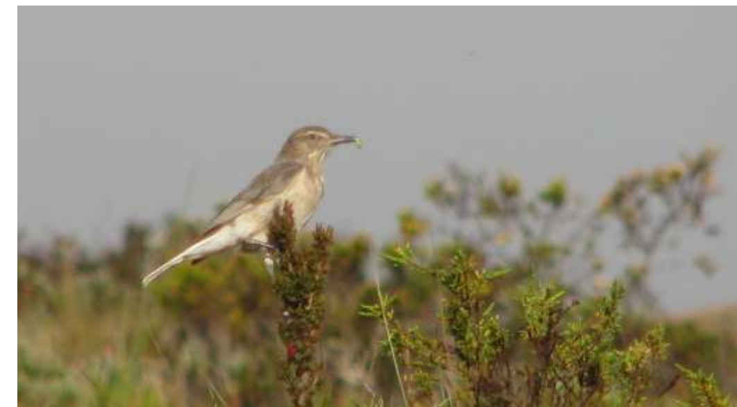
Agriornis montanus "huifio"

Estas y otras especies de aves son abundantes y características de esta formación vegetal, y su forma de vida está asociada directamente con las funciones ecológicas del "páramo".