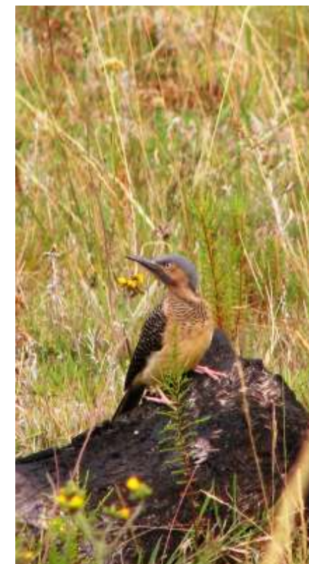
Colaptes rupicola "cangana"