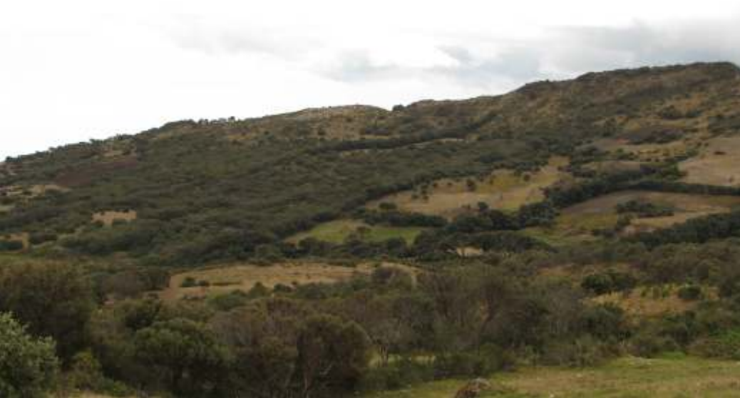
Vista panorámica del bosque de polylepis "quinawiros" - el Espino

a) La parte baja está representada principalmente por el Bosque de polylepis , el cual está fraccionado por extensas áreas de cultivo y pastizales. Es una zona fuertemente intervenida.