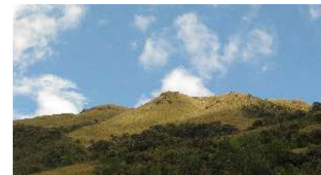
Bosques montanos húmedos "bosques nublados", Huanhuar - Huancabamba.

Lamentablemente, los esfuerzos dirigidos hacia el estudio de la diversidad biológica de estas zonas han sido escasos, por lo que es necesario realizar más investigación científica para conocer su verdadera importancia ecológica y mantener el equilibrio natural en estos ecosistemas. En este sentido, hay que tener en cuenta que estos ambientes son las principales fuentes de recursos naturales del sureste de la Región Piura, que a su vez están expuestos a la colonización por especies exóticas, a las quemadas y la deforestación, a la minería informal, a la agricultura expansiva, la cacería, entre otras actividades productivas, que crecen diariamente en mayor proporción a las acciones de conservación y aprovechamiento sostenible.