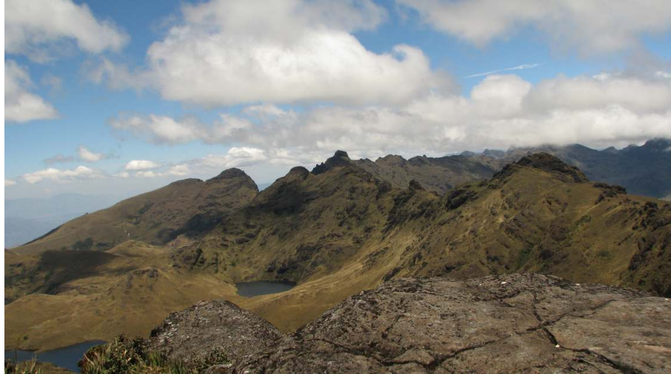
Vista panorámica de las lagunas Arreviatadas y la parte alta de las montañas. El Porvenir- Huancabamba.

En cuanto a altitud, en el Perú, no existe un límite altitudinal claro para designar este ecosistema, pues en algunos casos puede descender hasta los 2900 m, así como elevarse sobre los 3500 o hasta 3930 msnm, correspondiente al pico montañoso más alto en Piura, por lo que consideraremos que el páramo en Perú puede inclinarse desde los 2900 hasta los 3950 msnm.