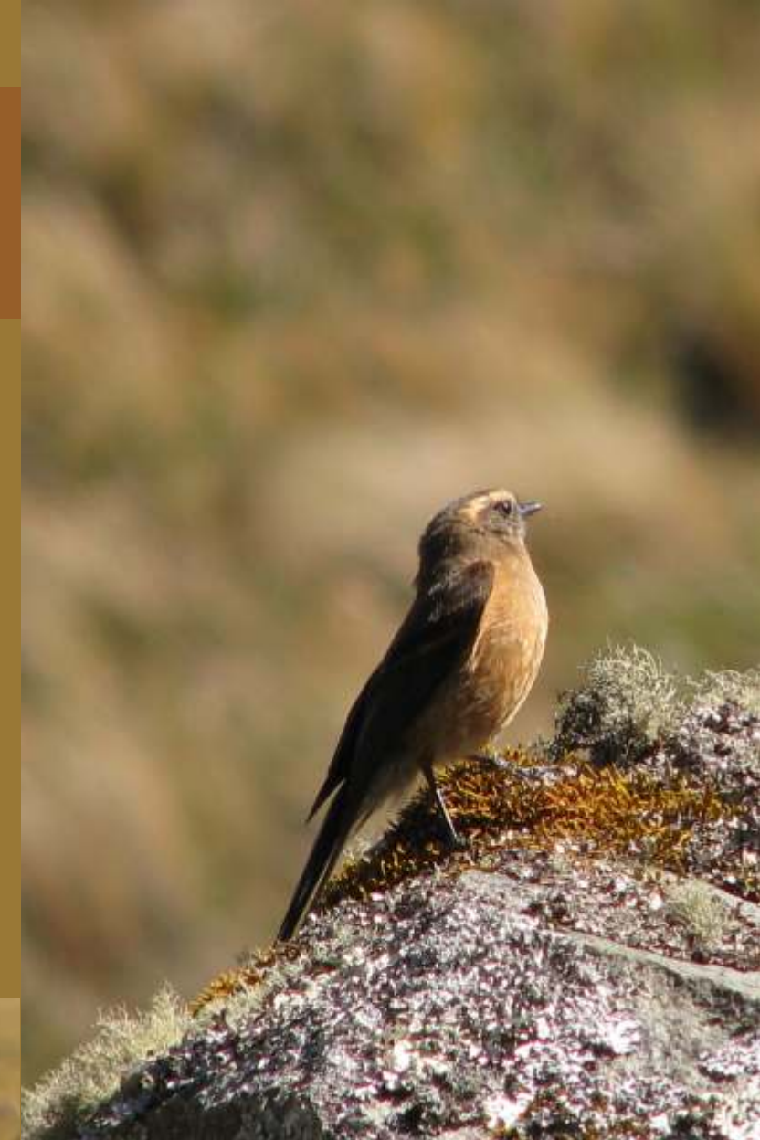
Ochthoeca fumicolor “pitajo dorso pardo”

Además, en los pajonales habitan otras formas de vida: 23 especies de aves, lagartijas del género Stenocercus , ranas marsupiales, y otros anfibios como el pequeño Lynchius parkeri que es un sapito endémico de los ecosistemas de alta montaña de los Andes del Norte.