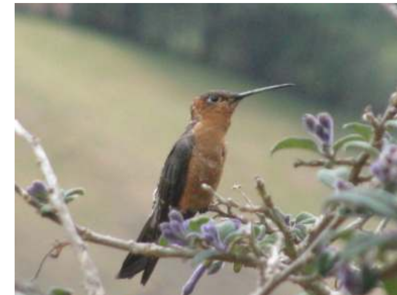
Patagonia gigas "Quinda vieja"

La "cangana", es un pájaro típico de los ecosistemas de alta montaña, es el pájaro carpintero más grande que se puede observar en estos bosques.