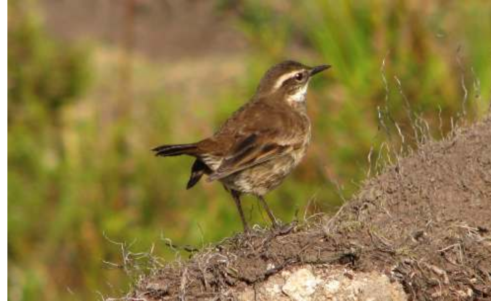
Cinclodes albidiventris "churrete ala castaña"

En la parte alta, en el Pajonal es común observar cerca de los pequeños arroyos de agua a Cinclodes albidiventris "Churrete de Ala Castaña", Vanellus resplendens "Avefría Andina o Liclique", Nothoprocta curvirostris "Perdiz de Pico Curvo", Agriornis montanus "Huifio, Solitario", Ochthoeca fumicolor "Pitajo de Dorso Pardo" y escuchar entre los pajonales a Asthenes flammulata "Canastero Multilistado".