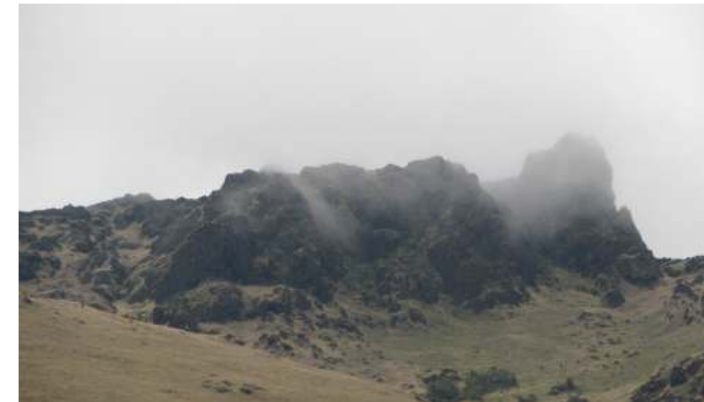
Montañas de la parte alta de la laguna Shimbe

Entre la parte media y alta, no existe una diferencia muy marcada que establezca el principio y fin de cada una. Sin embargo, es posibles identificarlas si tomamos como criterio el tamaño de la vegetación, el relieve y el clima.