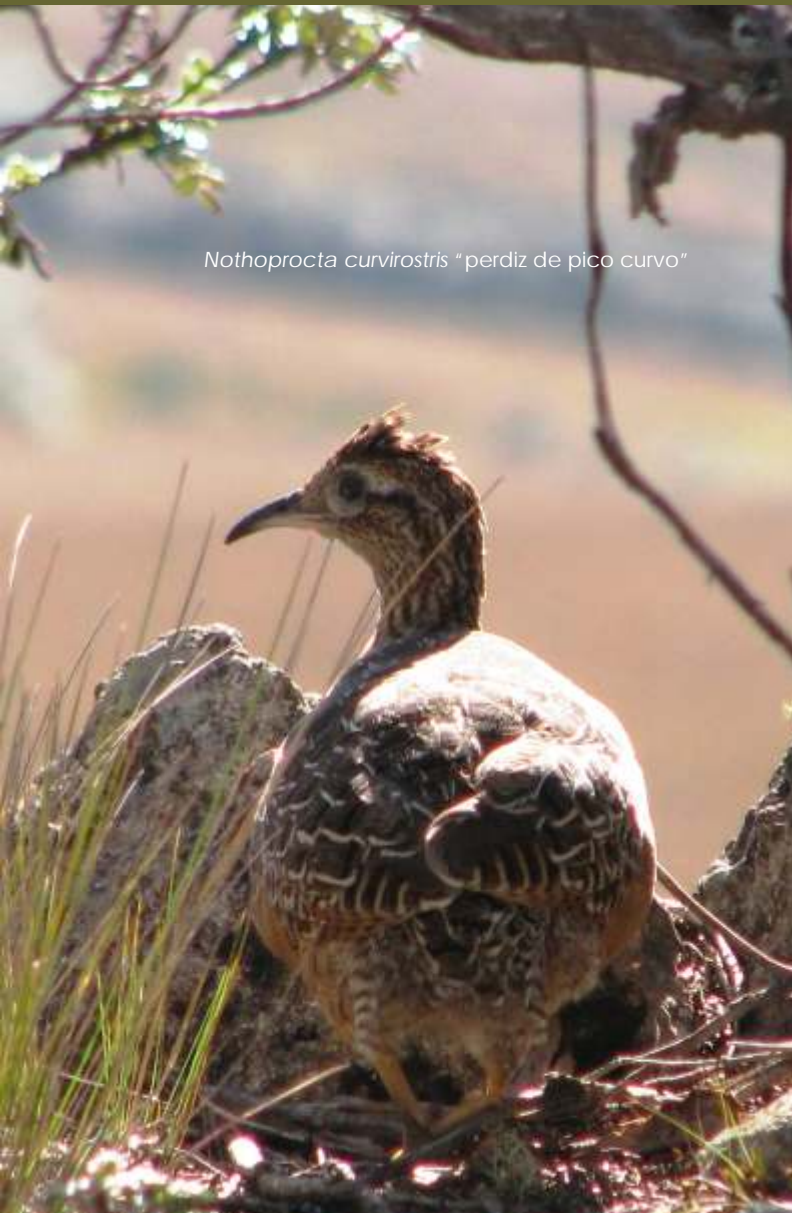
Nothoprocta curvirostris "perdiz de pico curvo"