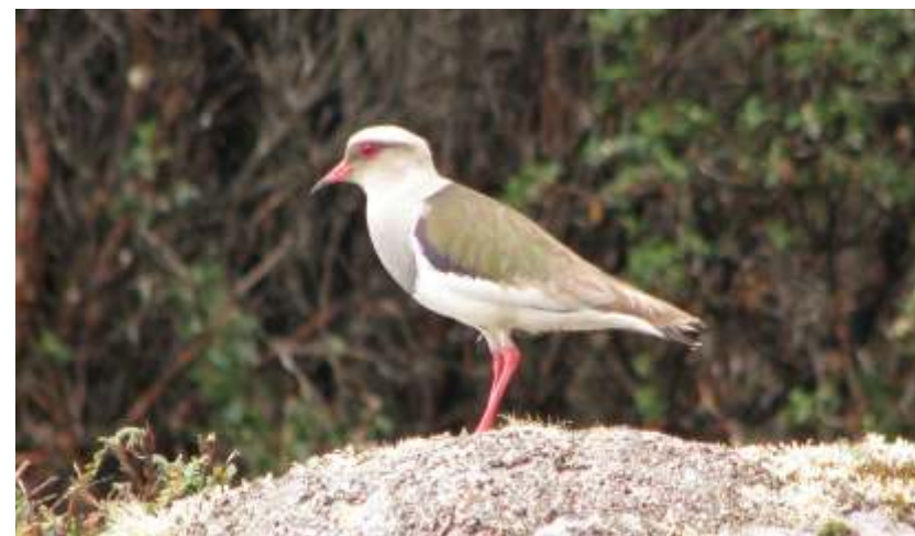
Vanellus resplendens "liclique"