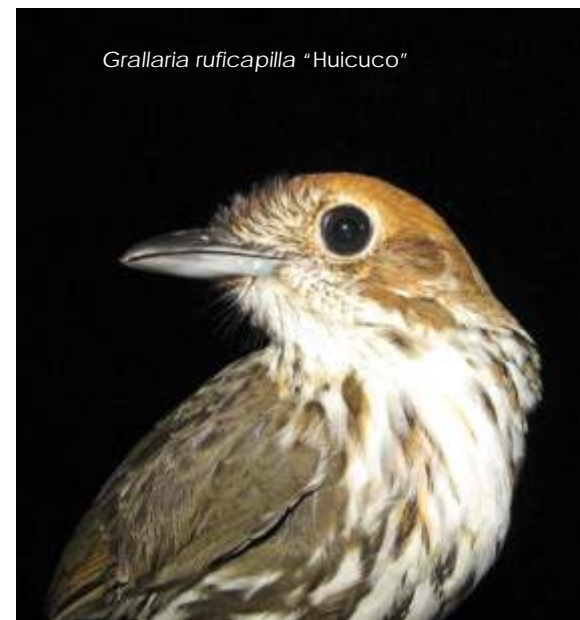
Grallaria ruficapilla "Huicuco"