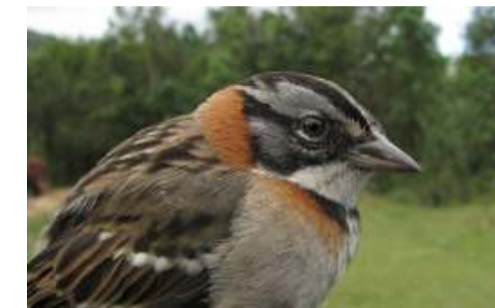
Zonotrichia capensis "gorrion"

La "cangana", es un pájaro típico de los ecosistemas de alta montaña, es el pájaro carpintero más grande que se puede observar en estos bosques.