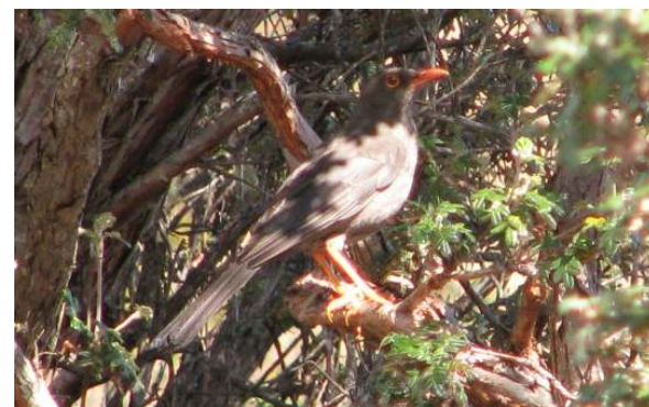
Turdus fuscater "chuquiaque"

Las especies de aves registradas para los bosques de Polylepis son 45, casi todas propias de esta formación siendo las más comunes de observar y escuchar: Aglaeactis cupripennis "Quinde Colorado", Patagonia gigas "Quinde vieja", Turdus fuscater "Chuquiaque", Colaptes rupicola "Cangana", Zonotrichia capensis "Gorrion", Diglossa humeralis "Pincha-Flor Negro o Churiza", Anairetes parulus "Torito Copetón o Cachudito", Phalcoboenus megalopterus "Caracara Cordillerano o Huerequeque".