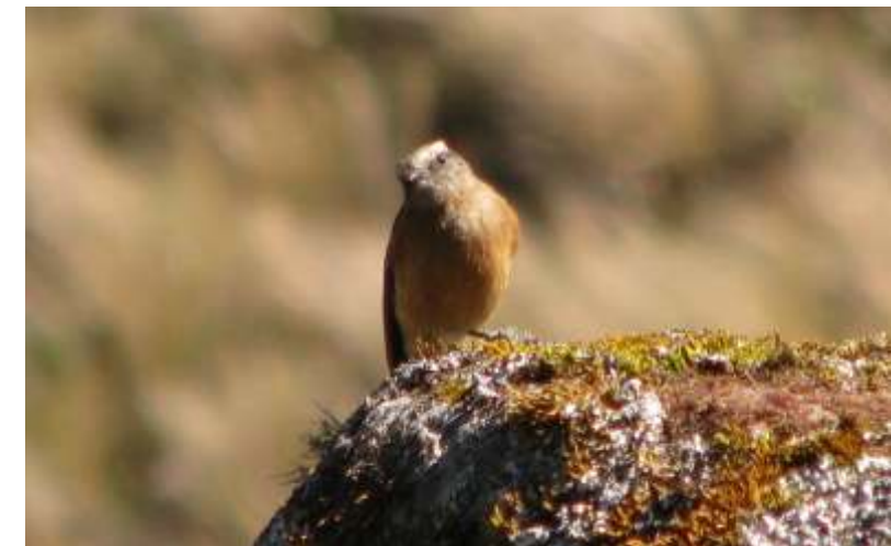
Ochthoeca fumicolor "Pitajo de dorso pardo"