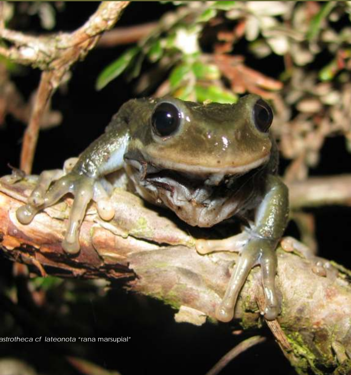
Gastrotheca cf lateonota "rana marsupial"