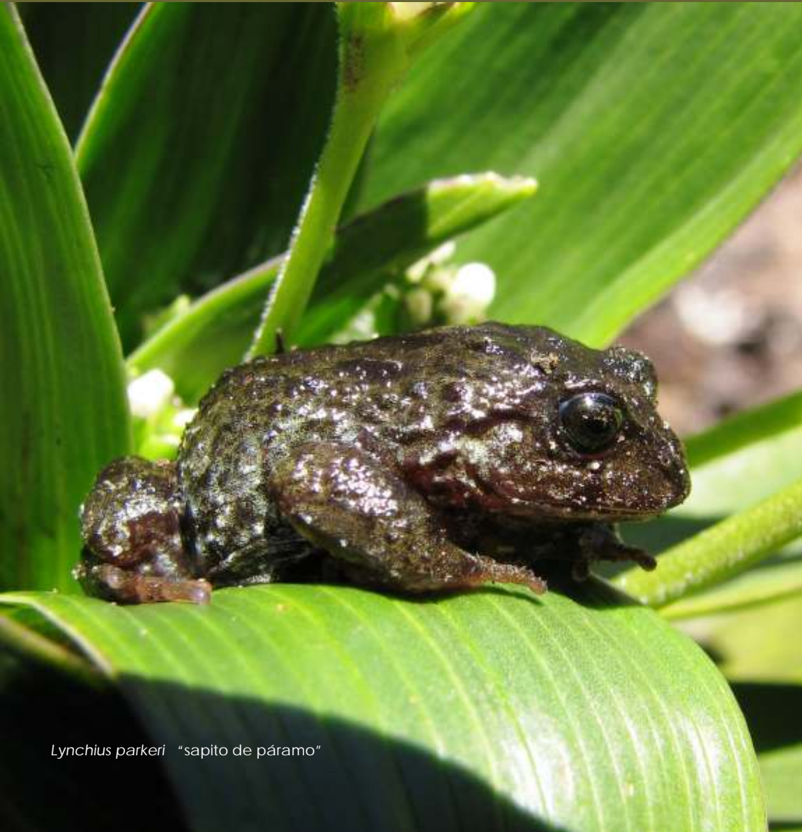
Lynchius parkeri "sapito de páramo"

Lynchius parkeri , entre otras especies de anfibios es una de las especies emblemáticas de los ecosistemas altoandinos. Es un pequeño sapito de 1.5 cm de longitud, habitante del pajonal y bosque de borde que rodea a las lagunas altoandinas.