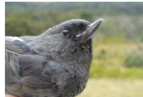
Diglossa humeralis "Churiza"