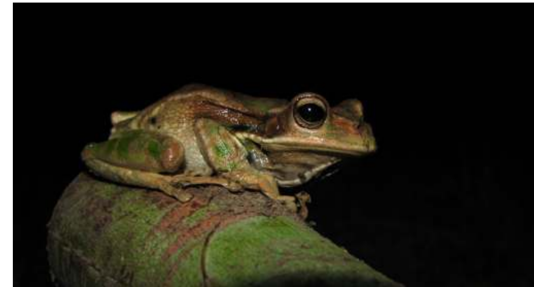
Gastrotheca monticola "rana Marsupial"