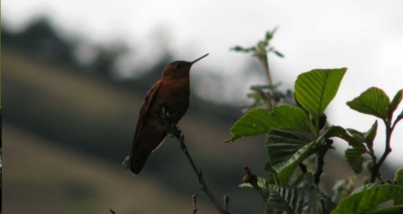
Aglaeactis cupripennis "quinde colorado"

Las especies de aves registradas para los bosques de Polylepis son 45, casi todas propias de esta formación siendo las más comunes de observar y escuchar: Aglaeactis cupripennis "Quinde Colorado", Patagonia gigas "Quinde vieja", Turdus fuscater "Chuquiaque", Colaptes rupicola "Cangana", Zonotrichia capensis "Gorrion", Diglossa humeralis "Pincha-Flor Negro o Churiza", Anairetes parulus "Torito Copetón o Cachudito", Phalcoboenus megalopterus "Caracara Cordillerano o Huerequeque".