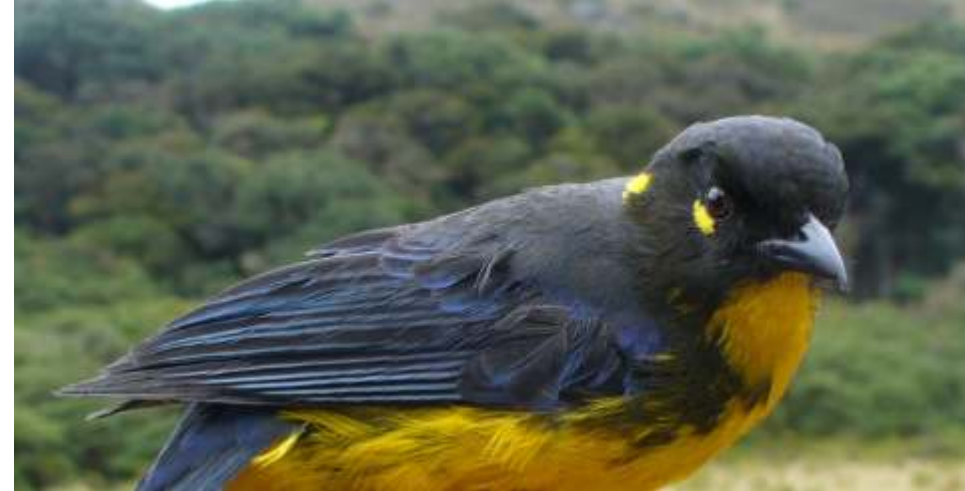
Anisognathus lacrymosus "Tangara de Montaña Lacrimosa"

También, es común observar otras especies de aves como: Metallura tyrianthina "Colibrí Tirio", Ampelion rubrocristatus "Cotinga de Cresta Roja", Diglossa humeralis "Churiza", matorraleros como Atlapetes latinuchus "Matorralero de Nuca Rufa" y Myioborus melanocephalus griseonuchus "Candelita de Anteojos", semilleros como Pheucticus chrysogaster "Picogrueso de Vientre Dorado" y gralarias o "Huicuco" Grallaria ruficapilla .