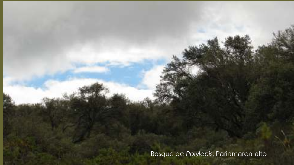
Bosque de Polylepis , Pariamarca alto

A esta formación vegetal se la denomina "Quinawiral" y está dominada por poblaciones de Polylepis reticulata , que han quedado restringidos a laderas rocosas, riscos empinados y quebradas. Además, en estos relictos de bosque, podemos encontrar otras especies arbóreas características de los bosques montañosos como: Lomatia hirsuta , Myrsine latifolia , Oreocalis grandiflora y especies introducidas o exóticas del género Eucalyptus y Pinus .