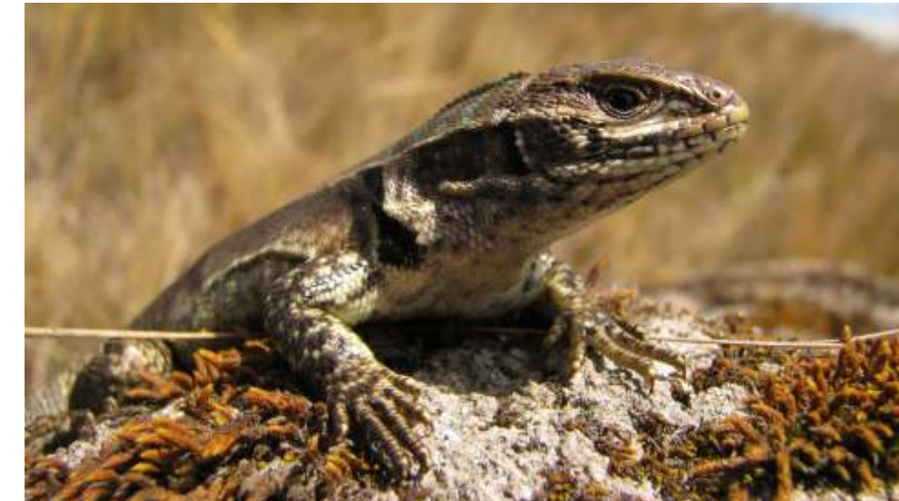
Stenocercus nubicola . "lagartija"

Es importante comprender la función ecológica de estas especies, en el caso de los anfibios (ranas y sapos) por tener un estadio larval de vida acuática, son muy sensibles a pequeños cambios en su ambiente producidos por sustancias contaminantes. Pueden ser utilizados como especies indicadoras de calidad de agua, entre otras funciones ecológicas.