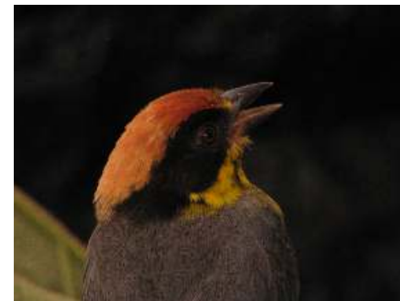
Atlapetes latinuchus "Matorralero de Nuca Rufa"