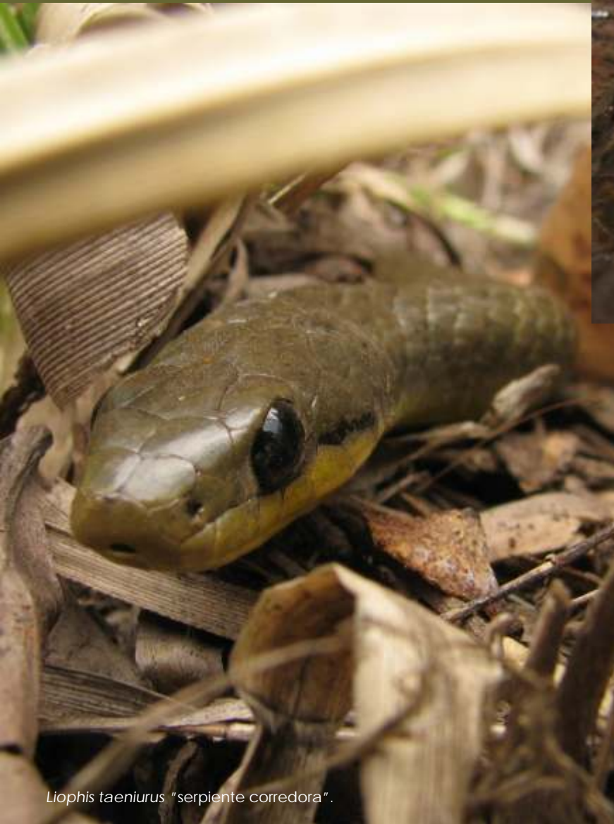
Liophis taeniurus "serpiente corredora".