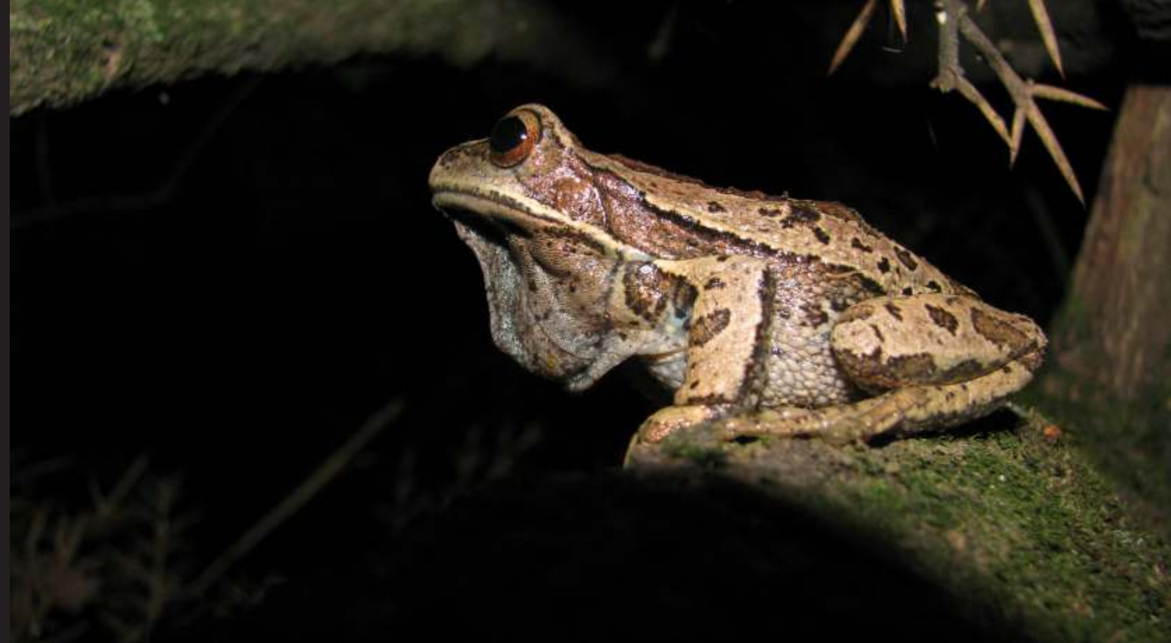
Gastrotheca cf monticola "rana marsupial"

En los bosques de Polylepis es muy frecuente escuchar y observar dos especies de ranas arborícolas, que taxonómicamente pertenecen a la familia Amphignathodontidae; Gastrotheca cf monticola y Gastrotheca cf lateonota , llamadas comúnmente "ranas marsupiales".