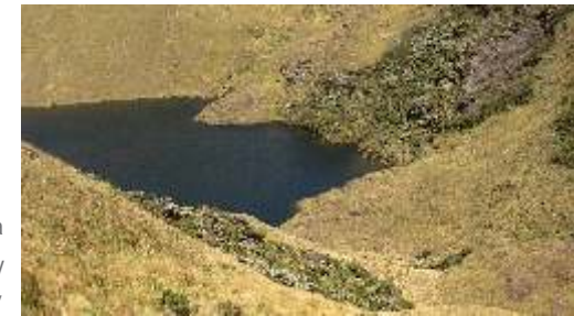
Laguna negra y bosques de la parte media El Porvenir

c) La parte alta: Comprende el área ubicada en la cumbre de las montañas. Son generalmente pedregosas, muy húmedas y frías, con fuertes vientos que con la neblina forman un tipo de llovizna que cae casi horizontal. En esta zona prosperan las mismas especies de la parte media, pero éstas son más pequeñas y achaparradas.