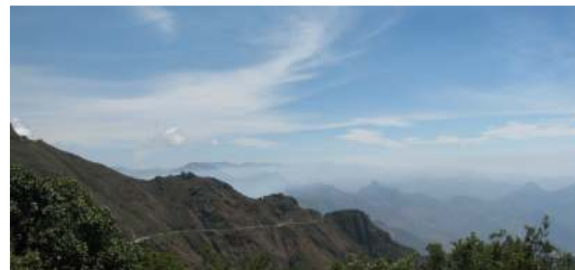
Toma panorámica del relieve y la geografía de las montañas de la Provincia de Huancabamba.

Especie endémica, se define como aquella especie cuya distribución geográfica se restringe a una determinada área o región.